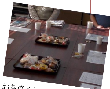
お茶菓子をつまみながら...